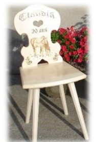
Chaise en bois Dès CHF 350.--