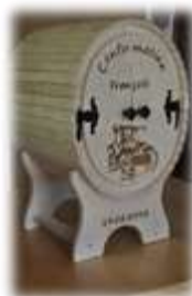
Tonnelet en bois CHF 450.--