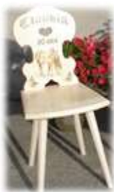
Chaise en bois Dès CHF 350.--