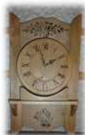
Horloge Dès CHF 200.--

Les dons en nature sont aussi possibles et appréciés, voici d'autres exemples possibles :