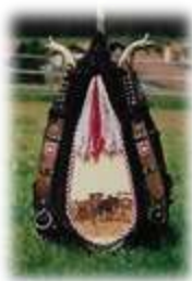
Collier de cheval CHF 350.--