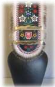
Toupin Dès CHF 900.--

Avec vos sponsorings des pages précédentes, nous pourrions entre autres acheter les prix pour les jeunes lutteurs ou quelques-uns des prix que nous vous montrons ci-dessous, à titre d'exemple.