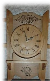
Horloge Dès CHF 200.--

Les dons en nature sont aussi possibles et appréciés, voici d'autres exemples possibles :