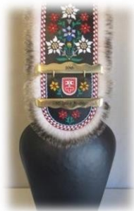
Toupin Dès CHF 900.--

Avec vos sponsorings des pages précédentes, nous pourrions entre autres acheter les prix pour les jeunes lutteurs ou quelques-uns des prix que nous vous montrons ci-dessous, à titre d'exemple.