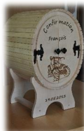
Tonnelet en bois CHF 450.--