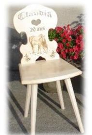
Chaise en bois Dès CHF 350.--