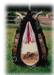
Collier de cheval CHF 350.--