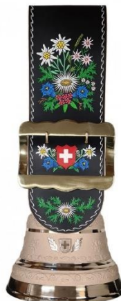
Cloche Dès CHF 450.-