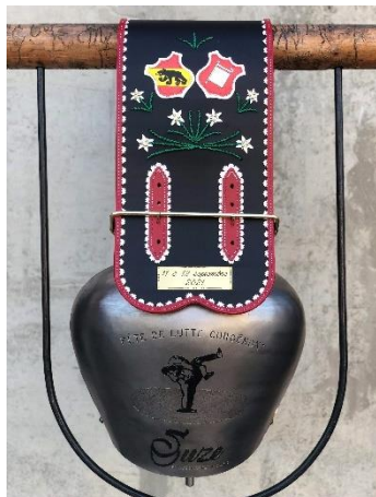
Toupin Dès CHF 900.-

Avec vos sponsorings des pages précédentes, nous pourrions entre autres acheter les prix pour les jeunes lutteurs ou quelques-uns des prix que nous vous montrons ci-dessous à titre d'exemple.