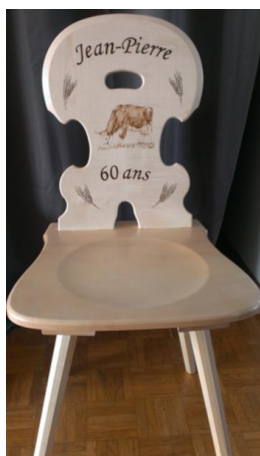
Chaise en bois Dès CHF 350.-