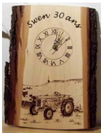
Horloge Dès CHF 200.-

Les dons en nature sont aussi appréciés, voici quelques exemples :